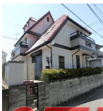
◆外壁塗装済のお洒落な洋館