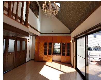
◆二面採光のリビング