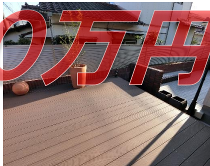
◆ウッドデッキを新設