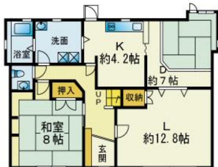
◆現地は日当たり良好です。