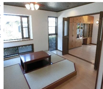
◆ダイニングに掘ゴタツ