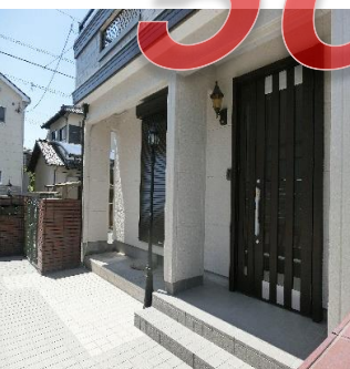
◆ヨーロッパ調の外灯を設置したアプローチ