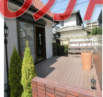
◆ウッドデッキを新設