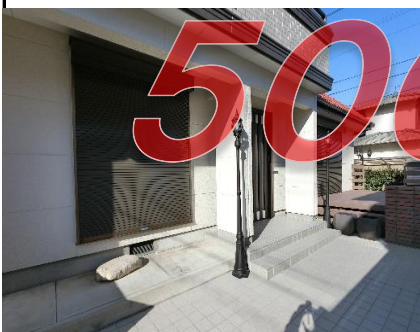
◆ヨーロッパ調の外灯を設置した玄関