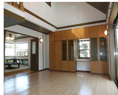
◆二面採光のリビング