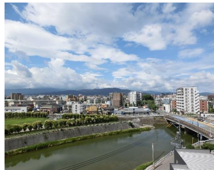
バルコニーからの眺望