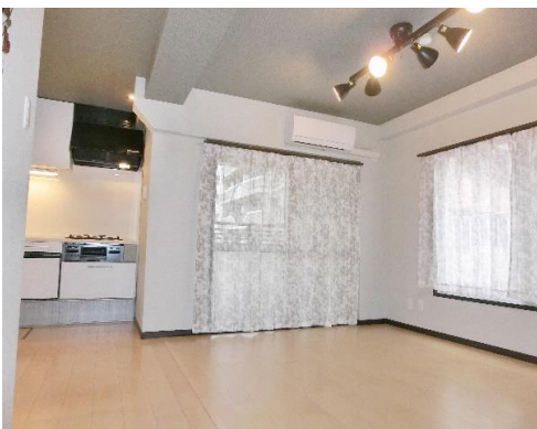
窓が二面あり、明るいリビングダイニング