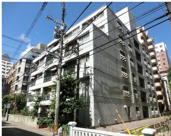
白を基調とした明るい外観

物件名・ 藤和平尾コープ 所在地・ 福岡市中央区平尾2丁目12-8 間取り・ 2LDK 専有面積・ 壁芯 / 63.32㎡ 内装・ フルリノベーション済 / 即入居可