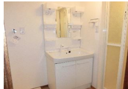
リノベ前の洗面化粧台