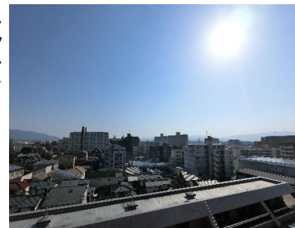
バルコニーからの眺望