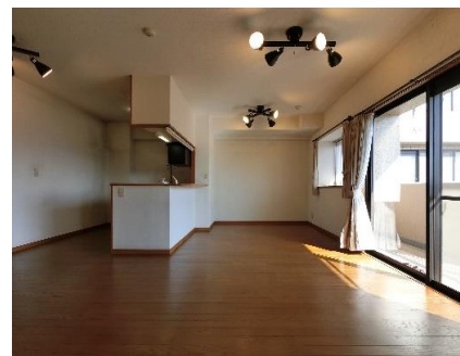
リビングダイニング