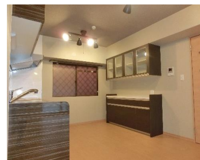
キッチン・備付け棚