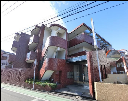
▲赤レンガ調の明るい外観

物件名・ロマネスク井尻 所在地・福岡市博多区諸岡5丁目27-9 間取り・3LDK 専有面積・壁芯 / 69.24㎡ 内装・フルリノベーション済 / 即入居可