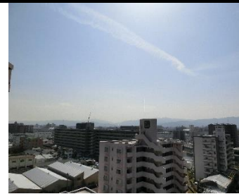
▲バルコニー(南向き)