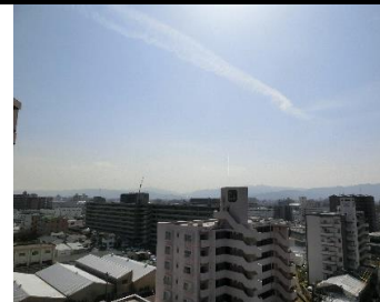
▲バルコニー(南向き)