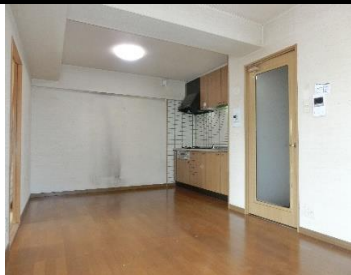
▲リビングダイニング