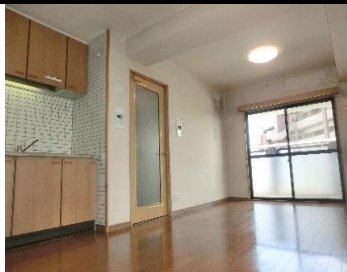
▲リビングダイニング