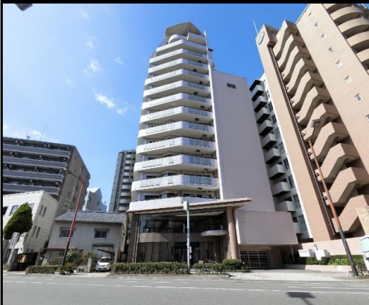
▲明るいホワイト調のタワーマンション