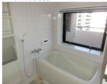
▲暖房乾燥機・窓付き浴室