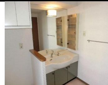
▲大型鏡・シャワー付き洗面所