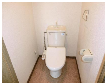
▲ウォシュレット付きトイレ