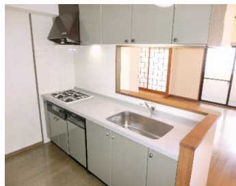
▲食洗機付きキッチン