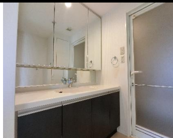
▲洗面所(三面鏡付き)