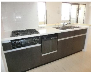
▲キッチン(食洗器付き)