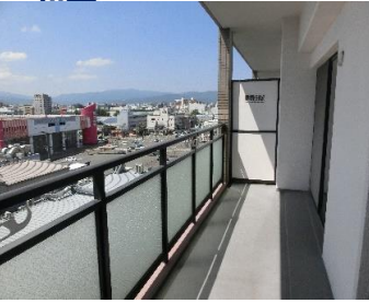
▲バルコニー(南向き)