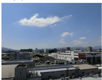
▲バルコニーからの眺望