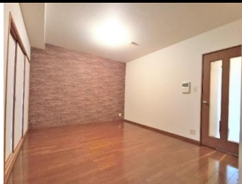
▲リビングダイニング