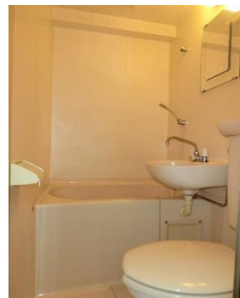
▲浴室・洗面所・トイレ

周辺の他の1K・1Rマンションと比較しても金額は安いです！ 安いゆえに、投資用・実需用のどちらでも使用でき、 万が一売却の場合でも築30年でこの価格ですので、 これ以上大幅な値下がりも考えにくいです！