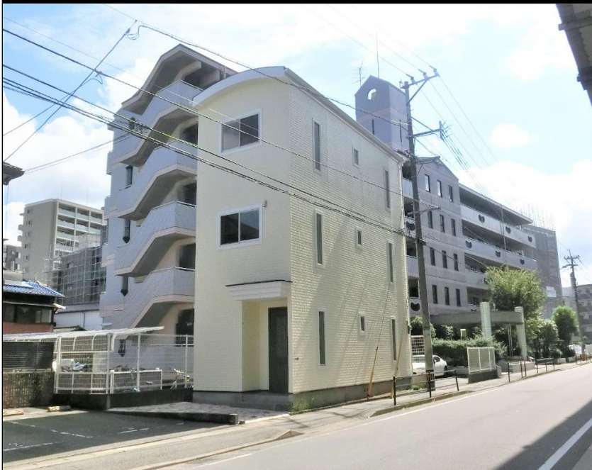
◆3階建てのベージュ調の外観。午前中から夕方まで日も入ります！