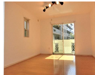
◆三面採光のリビング