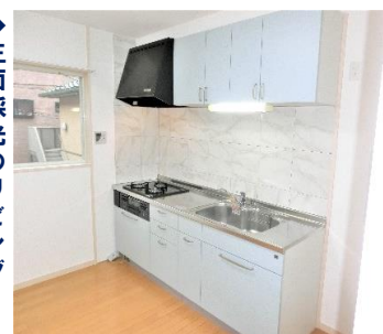
◆DKも二面窓で明るい