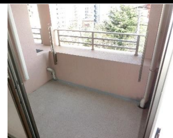
▲バルコニー(南向き)