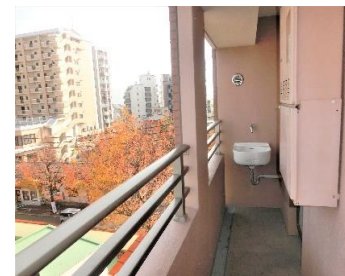
▲スロップシンク付き