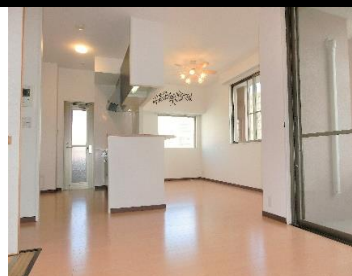
▲リビングダイニング