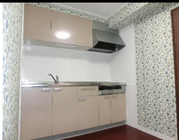
▲ダイニングキッチン