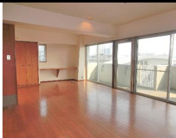
▲リビングダイニング