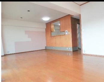
▲リビングダイニング