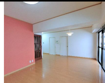
▲リビングダイニング