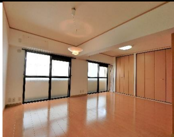
▲リビングダイニング