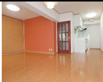
▲リビングダイニング