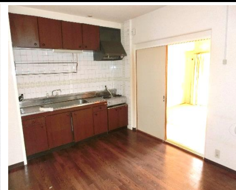
◆落ち着いた色合いと清潔感を感じれる雰囲気♪