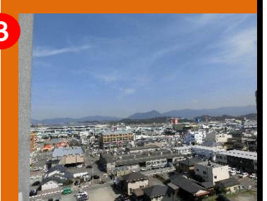
③ 洋室(5.5帖)からの眺望