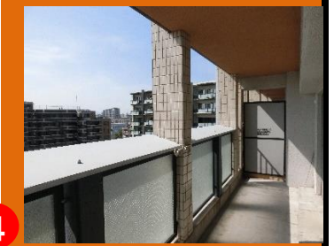
④ 南側バルコニーは日当たり良好

●所在地/福岡市博多区半道橋1丁目 ●交通/西鉄バス「半道橋」停 徒歩4分 ●築年数/1995年11月 ●構造/RC造11階建10階 ●管理形態/全部委託 ●管理費/3,850円 ●積立金/11,560円 ●現況/空室 ●引渡日/相談 ●総戸数/43戸 ●校区/那珂小学校、那珂中学校(※春住小学校、東住吉中学校の指定可) ●取引形態/売主