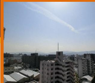
② 南側バルコニーからの眺望