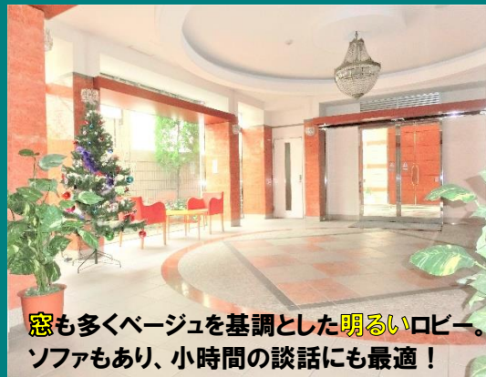
窓も多くベージュを基調とした明るいロビー。 ソファもあり、小時間の談話にも最適！