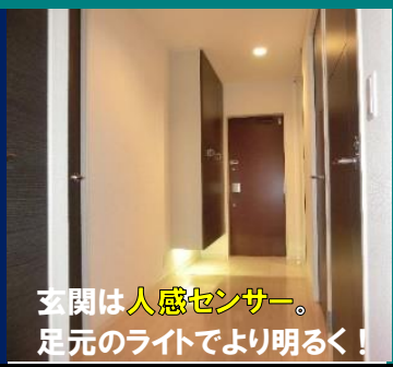
玄関は人感センサー。 足元のライトでより明るく！