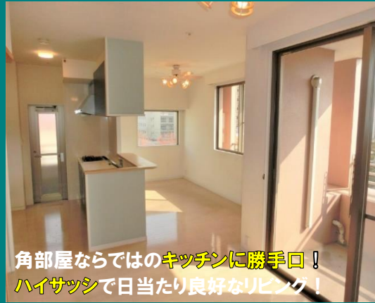
角部屋ならではのキッチンに勝手口！ ハイサッシで日当たり良好なりびんぐ！