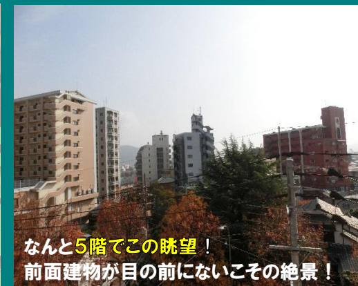
なんと5階でこの眺望！ 前面建物が目の前にないこの絶景！