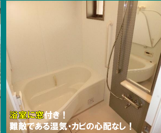
浴室に窓付き！ 難敵である湿気・カビの心配なし！