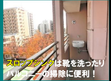
スロップシンクは靴を洗ったり バルコニーの掃除に便利！