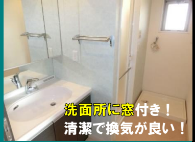
洗面所に窓付き！ 清潔で換気が良い！