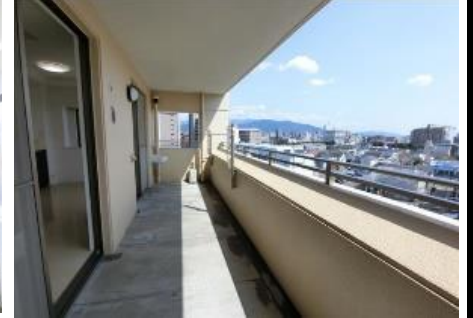
Point 5 ワイドスパンでスロップシンクが付いたメインバルコニー