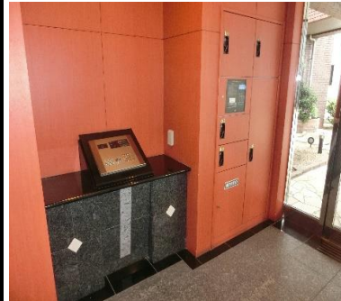
オートロック&宅配ロッカー