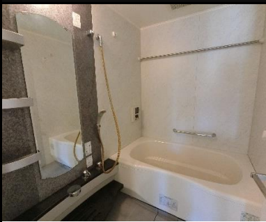
Point 1 16型テレビ・暖房乾燥機も付いた浴室