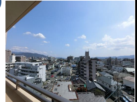
Point 6 遮る建物がない南側バルコニーからの絶景