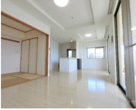
Point 4 南向きで広々としたリビングダイニングキッチン