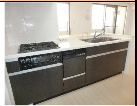
Point 7 食洗機内蔵で勝手口もある広々としたキッチン