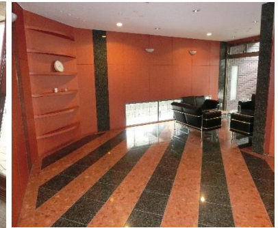
ソファも置いているモダンなロビー