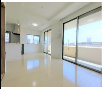
Point 3 ハイサッシで明るいリビングダイニング