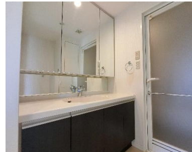
Point 2 大きな三面鏡付きの洗面化粧台