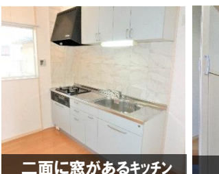
二面に窓があるキッチン