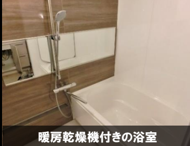
暖房乾燥機付きの浴室