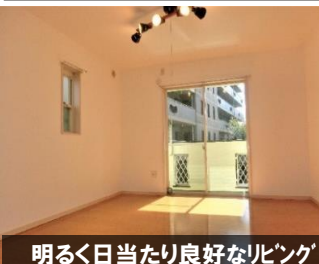
明るく日当たり良好なリビング

★キッチン・浴室・洗面所・トイレ・フローリング・クロスが新品！ ★駐車場2台可！しかも月額6,000円/台！ ★仲介手数料が無料！なんと約96万円もお得に！