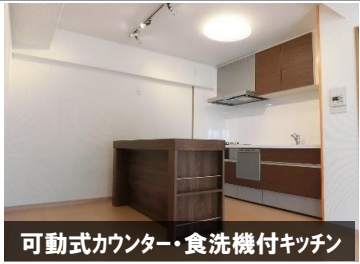
可動式カウンター・食洗機付キッチン