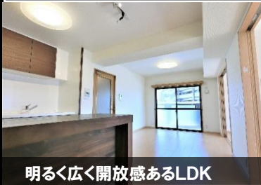
明るく広く開放感あるLDK