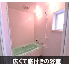
広くて窓付きの浴室